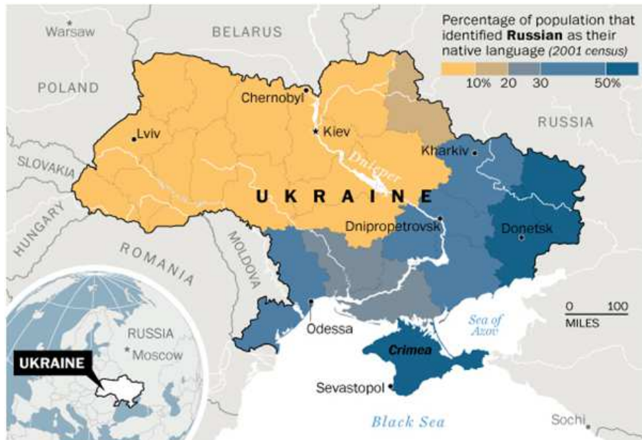
ภาพที่ 1 ประชาชนที่พูดภาษารัสเซีย

ประกอบด้วยประชาชนที่พูดภาษายูเครน และมีเศรษฐกิจส่วนใหญ่เป็นภาคอุตสาหกรรม การเมืองภูมิภาคนิยมของยูเครนทั้งสองส่วนยังมีผลต่อการเมืองของการเลือกตั้งอย่างมีนัยยะสำคัญมาโดยตลอด